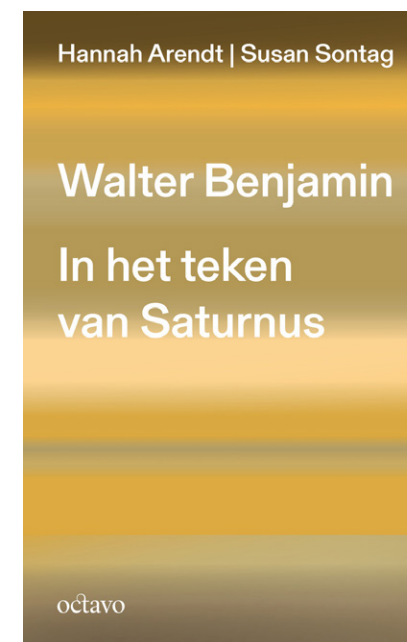
ISBN 978-94-90334-30-7 160 pag. | € 21,50