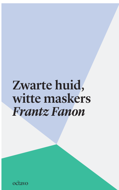
ISBN 978-94-90334-24-6 216 pag. | € 22,50