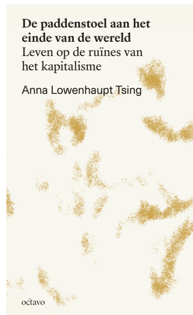
ISBN 978-94-90334-29-1 432 pag. | € 29,50