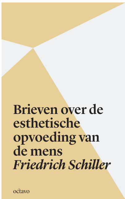
ISBN 978-94-90334-02-4 144 pag. | € 15,00