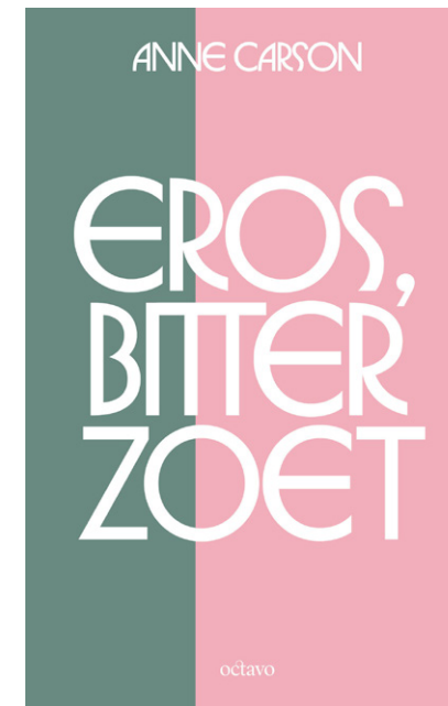
ISBN 978-94-90334-35-2 256 pag. | € 24,50