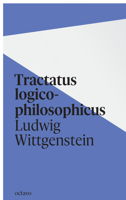
ISBN 978-94-90334-32-1 228 pag. | € 19,50