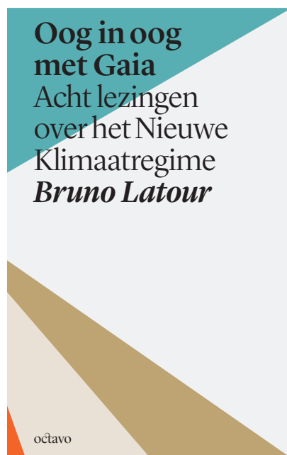
ISBN 978-94-90334-23-9 432 pag. | € 27,50